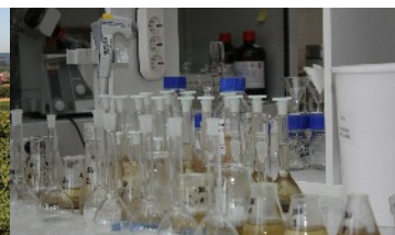
Controllo qualità di compost e biochar