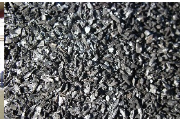
'ABC' – Biochar da ossa animali