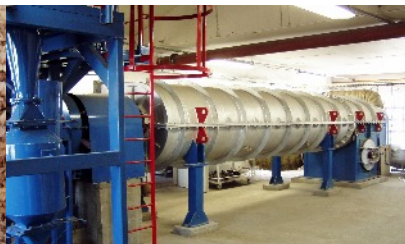
Unità produttiva per biochar "3R zero emissioni"