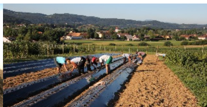
Prove sperimentali di campo del progetto REFERTIL