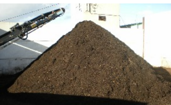
Il compost prodotto nel progetto REFERTIL

Dichiarazione di esclusione di responsabilità: L'autore è il solo responsabile del contenuto di questo documento, che non rappresenta necessariamente l'opinione della Comunità Europea.