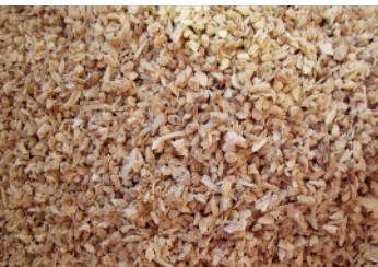
Materia prima a base di ossa animali per la produzione di biochar 'ABC'

Obiettivo principale di REFERTIL è di contribuire alla trasformazione efficiente ed economicamente vantaggiosa di rifiuti organici urbani, scarti alimentari industriali e rifiuti organici agricoli, partendo da un processo costoso di smaltimento per arrivare ad un'attività redditizia.